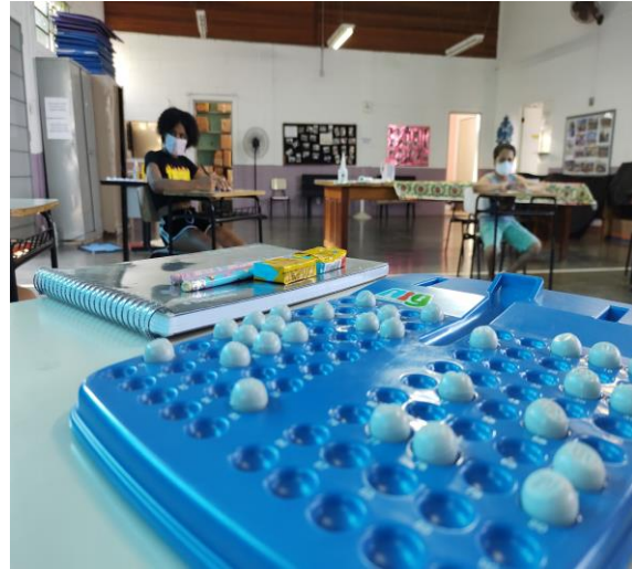
Atividade 2(crianças )