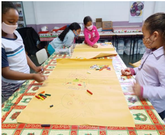
Atividade 3 (crianças)