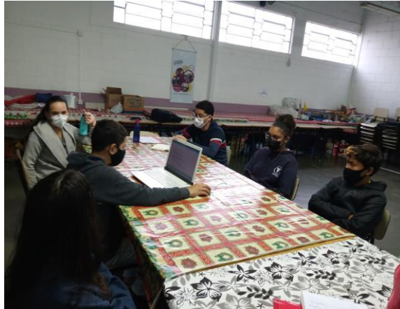
Atividade 2 (Adolescentes)