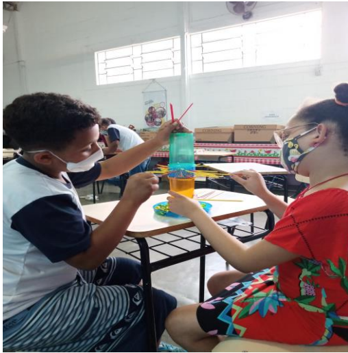
Atividade 1 (crianças )