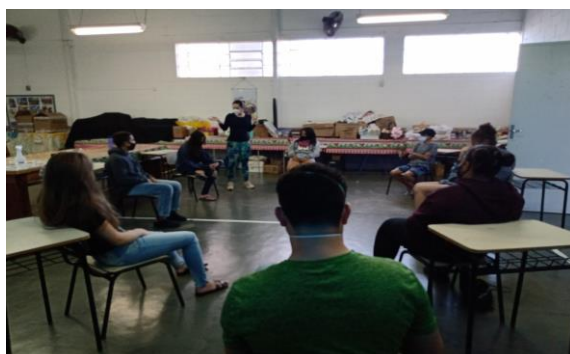
Atividade 4 (Adolescentes/ presencial)