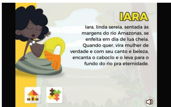
Atividade 4 (crianças e adolescente)