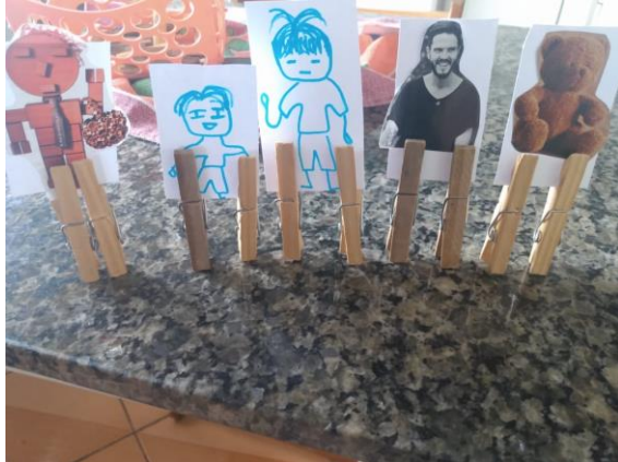
Atividade 3 (crianças e adolescente)