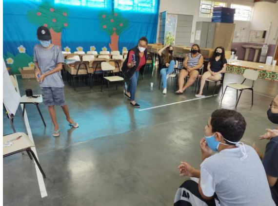
Atividade 3 (Adolescentes/ presencial)