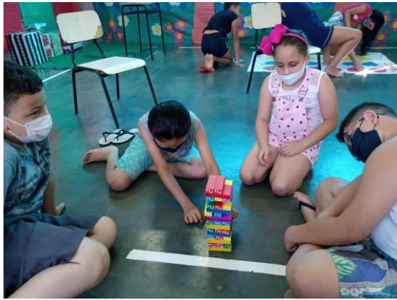
Atividade 1 (crianças )