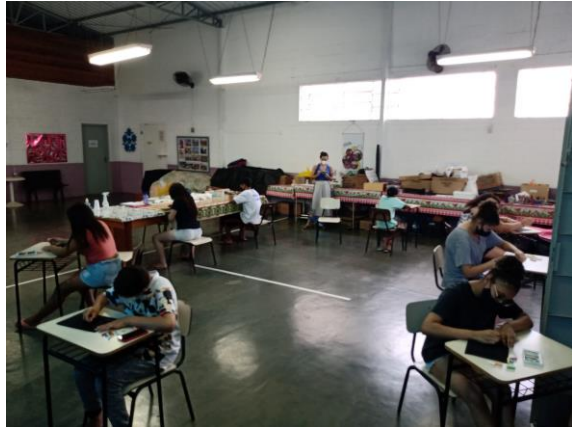
Atividade 2 (Adolescentes)