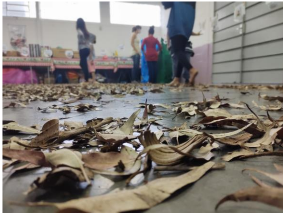
Atividade 3 (crianças)