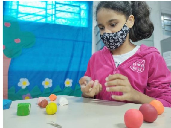
Atividade 2(crianças )