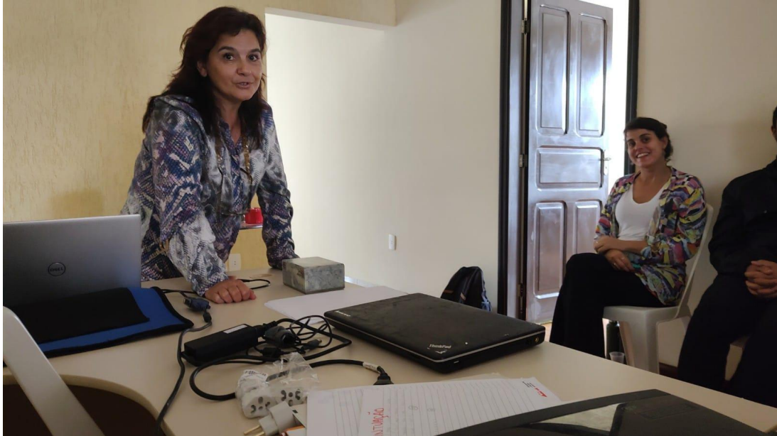
19/12 capacitação MSE.