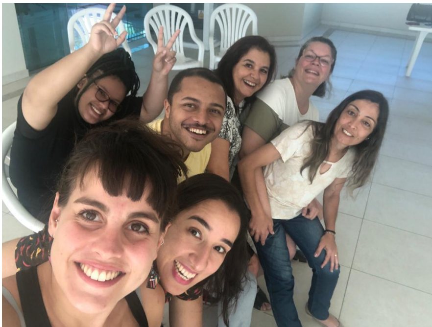
09/12 - Capacitação. Jogos cooperativos. Plano de trabalho.