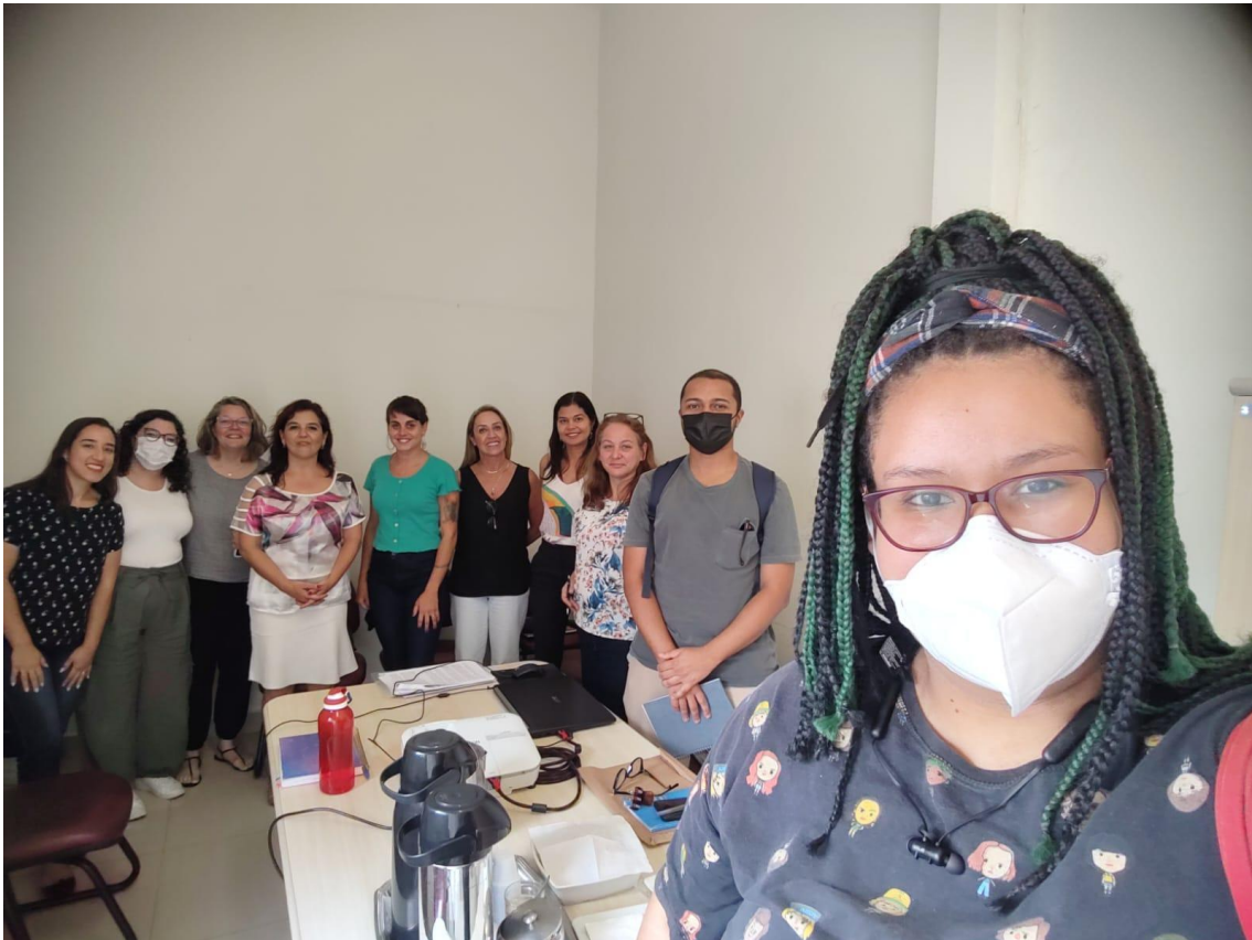
02/12 reunião no CREAS - com toda a equipe Inspira e a equipe de transição.