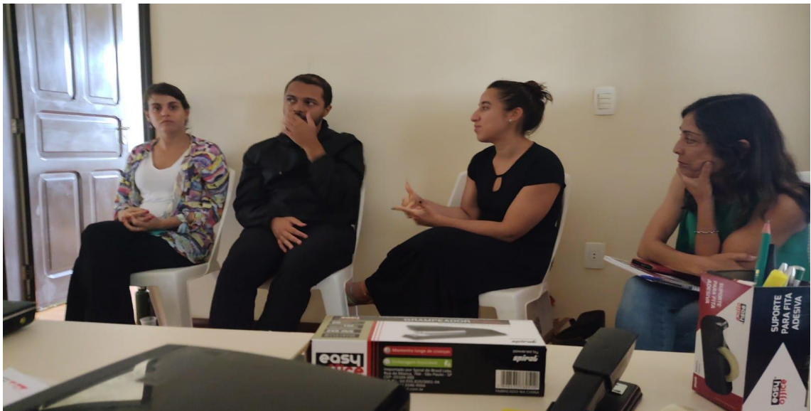
12/12 - reunião alinhamento e compartilhamento conhecimentos de diversas áreas afetas ao desenvolvimento do serviço.