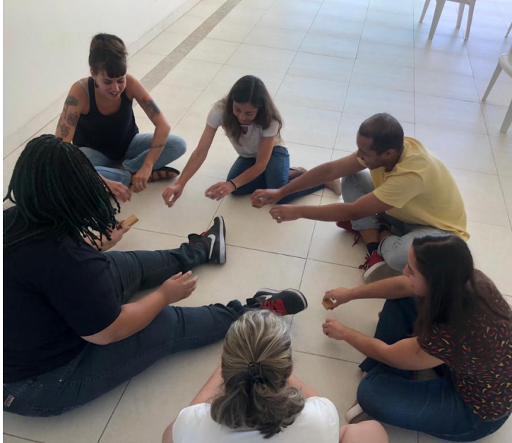
05/12 - reunião de equipe. Integração. Estudo do Plano de Trabalho.