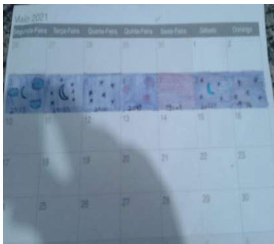
(Adolescente - Letícia)