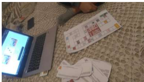
(Adolescente - Gabrielle)