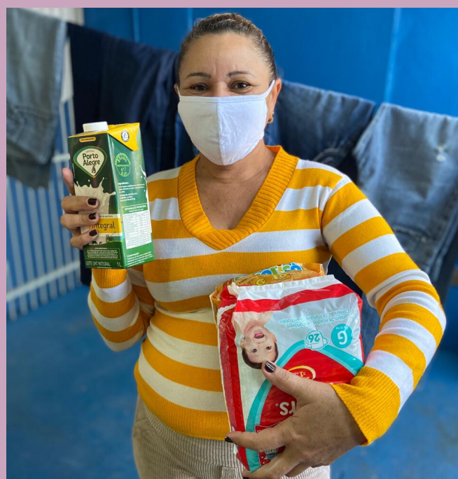
Entrega realizada em 07/07/2020

Em junho, a Associação Almater realizou uma campanha em parceria com a Rede 60+ de Jundiáí para arrecadar fraldas e leite.