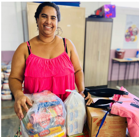
Entrega das cestas básicas fornecidas pela Prefeitura de Jundiaí